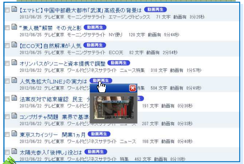
動画再生ボタンにカーソルを合わせた際の表示画面

また動画を再生せず、記事本文だけを閲覧したり、本文を確認した上で動画再生したりする方法もあります。